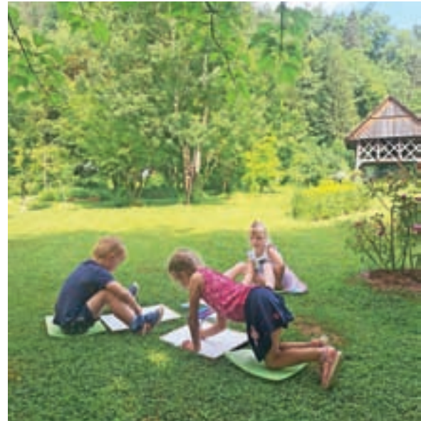
Ustvarjalno poletje v Kržišnikovem vrtu

»Naš cilj je, da z roko v roki ustvarjamo prijazen in kreativen vrtec. S sodobnimi pristopi na temeljih tradicije poskušamo dajati otrokom popotnico za življenje. Otroke spodbujamo iskati lastne poti in jim omogočamo aktivno ter raziskovalno okolje. Vodimo jih v razvoj kritičnega in ustvarjalnega razmišljanja. Krepimo sa-