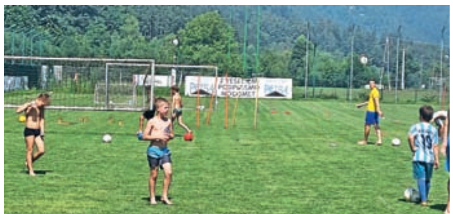
Nogometni klub Žiri je tudi letos konec avgusta pripravil poletno otroško nogometno šolo.

Otroci so se v prijetnem vzdušju pod vodstvom profesorjev in študentov športne vzgoje ter trenerjev mlajših kategorij Nogometnega kluba Žiri seznanili z nogometnimi veščinami, vsak dan pa so poskrbeli tudi za spremljevalne dejavnosti, v okviru katerih so imeli priložnost za sproščeno zabavo. Po besedah pomočnika vodje nogometne šole Naceta Mla-