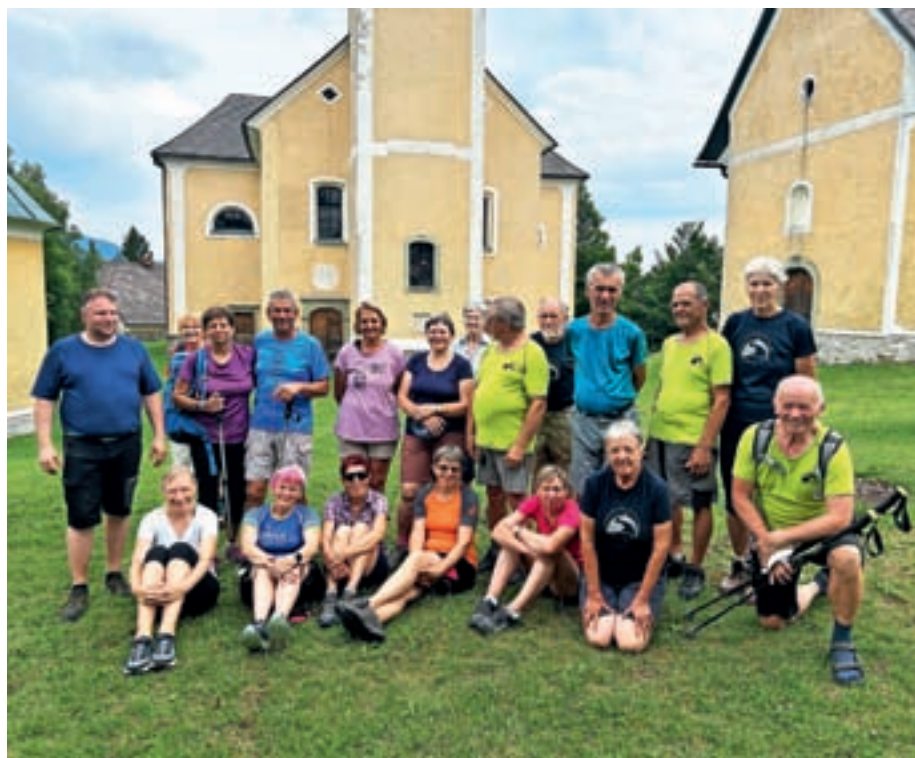
Cilj tokratnega romanja je bil Sveti Križ nad Belimi Vodami.

ki Brankove žene, ki sta tam našli svoja partnerja. Za nameček pa nas je prišla pozdravit tudi žirovska rojakinja. O gostoljubju in postrežbi ne gre izgubljati besed, bilo je vrhunsko. Še nekaj kilometrov pa nas je ločilo od prenočevanja v naselju Bočna. Četrty dan je bil morda najlažji, saj nas je čakalo nekaj manj kilometrov in zato nekaj več počitka. Proti Mozirju smo se odpravili preko Grušovja, Šentjanža in Spodnje Rečice. Po sicer glavni asfaltni cesti je ob pogovoru čas do Nazarij hitro mineval, nadalje pa tudi Mozirje ni bilo več prav daleč. Sledilo je še zadnje prenočevanje, tokrat v skavtskih prostorih. Po skromnejše prespani noči nas je prvič v dneh popotovanja pričakalo deževno jutro, a kmalu se je spet prikazalo sonce, ki nas je spremljalo do cilja. Cerkev na Svetem Križu nas je pogledovala izza dreves navzdol in korak je moral kar pošteno zagristi, da je premagal višince. Na prevalu smo si vzeli minutke za še zadnji odmor. Kot bi bili domenjeni, pa smo zasiljali glas avtobusa in napis na njem, takoj smo vedeli, da so naši romarji iz Žirov. O, kako smo jih bili veseli, še bolj pa tis-