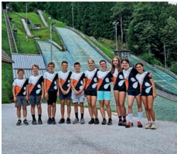
Nove majice za naše športnike

Ker smo na začetku novega šolskega leta, si želimo, da se nam v prihodnje pridruži še kak član, članica. Interesa bomo veseli na klubski naslov sskziri@gmail.com.