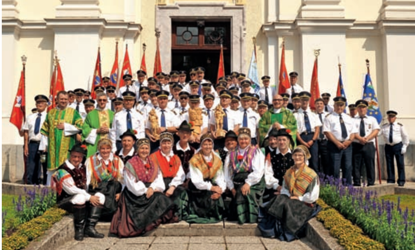
Praznovanje Krištofove nedelje v Žireh