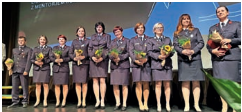
Ekipa članic B PGD Žiri

Članice B PGD Žiri tekmujejo od leta 2004, že drugo leto pa so osvojile občinski naslov in se uvrstile na regijsko tekmovanje in potem na državno tekmovanje. Naslov državnih prvakinj so osvojile še leta 2018, tudi sicer so se na tekmovanjih uvrščale med najboljše. »Vsako leto so nastopale na tekmovanju zveze in se uvrstile na regijsko in državno tekmovanje. Postale so prepoznavne in ni ga tekmovalca, ki ne bi slišal za mesto Žiri. Udeleževale so se tudi pokalnih tekmovanj, kjer so pridobile izkušnje in samozavest,« so poudarili predlagatelji priznanja. Leta 2020 pa so si na nastopu državne CTIF tekme