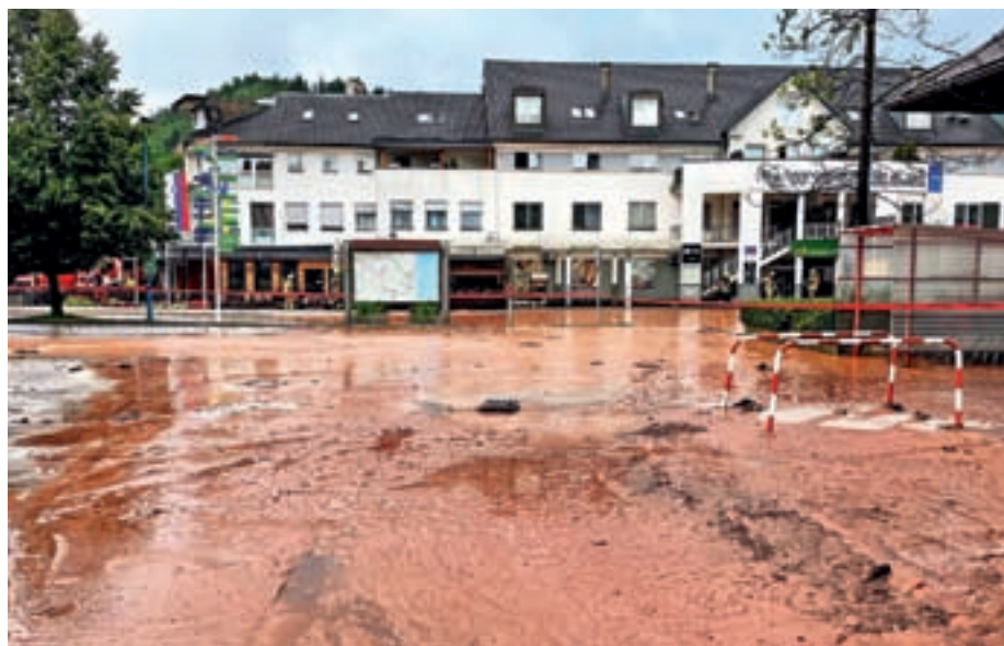
Razdejanje, ki so ga poplave pustile v Žireh

Že takoj po poplavah so vpoklicali 15 ekip strojnikov z gradbeno mehanizacijo, ki so vsak po svojih močeh in na svojem območju reševali situacijo. Približno teden dni je bilo v okviru intervencije v Žireh vzpostavljeno 24-urno dežurstvo. »Večino poti smo uredili in po njih znova normalno poteka promet, še vedno pa je zaprt del ceste proti Mrzlemu Vrhju, kjer bodo v okviru sanacije zaradi usadov potrebni večji posegi. Prav tako je težje dostopen tudi del Koprivnika,« je razložil župan. Ta