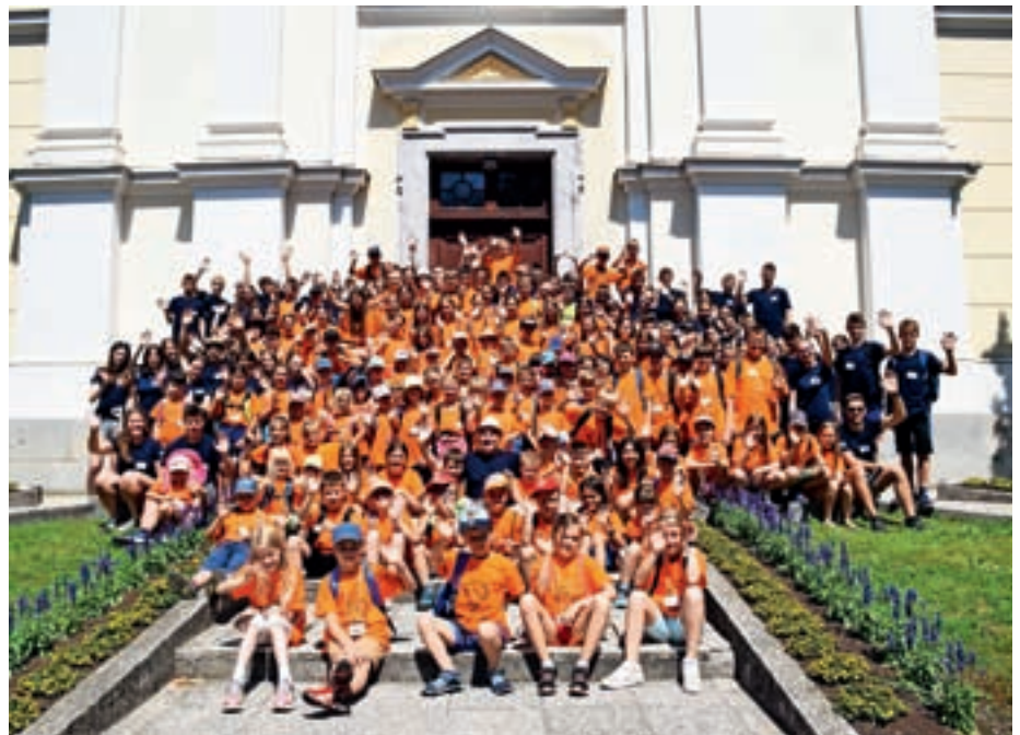
Oratorija se je letos udeležilo 125 otrok.

Vsako jutro smo se zbrali, zapeli oratorijsko himno, dvignili zastavo in si ogledali dramsko igrico, s katero smo spoznali hobita Bilba in njegove vrline. Nato smo na katehezah s pomočjo svetopisemskih odlomkov govorili o dnevnih vrednotah: poklicanost, božja previdnost, vztrajnost, srčnost in rast. Dopoldne so potekale še različne delavnice: arheološka, pustolovska, origami, glasbena, slaščičarska in druge. Po kosilu je sledila še velika igra,