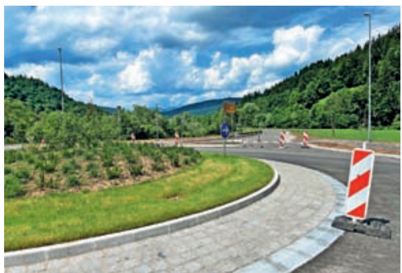
V juliju je stekel promet po novozgrajeni obvoznici.

»Po številnih zapletih nam je v juliju vendarle uspelo opraviti tehnični pregled in je bila cesta predana name-nu. Obvoznica je velika pridobitev zlasti za stari del Žirov,« je dejal župan Franci Kranj in dodal, da so z državo letos že podpisali tudi pogodbo za projektiranje nadaljevanja obvoznice proti industrijski coni. »Prizadevamo pa si, da bi bil v kratkem sprejet tudi nov občinski prostorski načrt, ki bo omogočil pridobitev gradbenega dovoljenja za njeno gradnjo.«