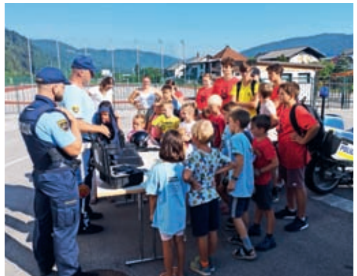
V okviru aktivnih počitnic so otroci spoznavali različne poklice.

Tedni so bili obarvali tematsko, rdeča nit je bilo spoznavanje poklicev, različni športi, spoznavanje človeškega telesa, gusarski dnevi, naravoslovne teme. Svoje delo so nam predstavili policisti, obiskali smo dobročevske gasilce, dopoldne preživeli s taborniki Rodu Zelenega Žirka, imeli polno ustvarjalnih de-