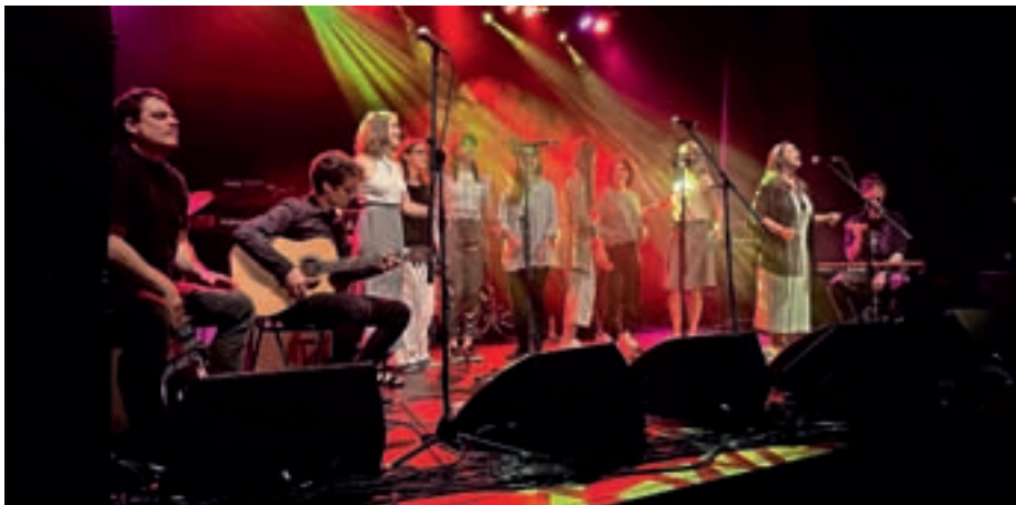
Na dobrodelnem koncertu v Žireh so zbrali 3250 evrov za žirovske gasilce in prizadete v poplavah.