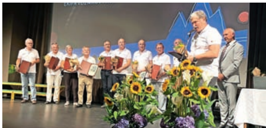
Vozniki Prostoferja

V obrazložitvi priznanja so zapisali, da so vozniki postali »rešilna bilka za Žirovce, ki ne morejo voziti sami in potrebujejo pomoč pri vsakodnevni opravih.« Lani so vozniki prostovoljci opravili 223 prevozov, z vozilom Prostoferja pa so do konca lanskega leta prevozili 56.250 kilometrov. »Nemogoče pa je s statistiko opisati pomen vsake vožnje na zdravniške preglede, v trgovino ali preprosto družabna srečanja, ki jih starejši pogosto zelo pogrešajo.« Največ prevozov so sicer vozniki opravili v bolnišnico in zdravstvene domove. »Vsi vozniki so aktivni tudi na drugih področjih družbenega življenja in so prostovoljci z velikim