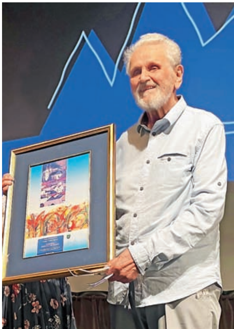
Častni občan Zdravko Mlinar

»Mlinarjeva zgodnja ljubezen do sociologije je botrovala dejstvu, da je postal eden od ustanovnih očetov slovenske sociologije kot znanstvene discipline.« Sociologiji je posvetil vse svoje življenje, na znanstvenem področju se je izpopolnjeval tudi v tujini in objavljaval v socioloških publikacijah svetovnega pomena. »V Žireh je opravil svojo prvo sociološko raziskavo, ki je bila tudi prva sociološka raziskava v Sloveniji. Na podlagi izhodiščnih raziskovanj na področjih urbane in ruralne sociologije, lokalne samouprave in urbanizma ter regionalnih študij je kot prvi pri nas in v mednarodnem merilu zasnoval raziskovalno in pedagoško področje prostorske sociologije.« Kot še navajajo v utemeljitvi priznanja, sta leta 1978 Zdravko Mlinar in Henry Teune objavila eno od temeljnih del teorije družbenega razvoja