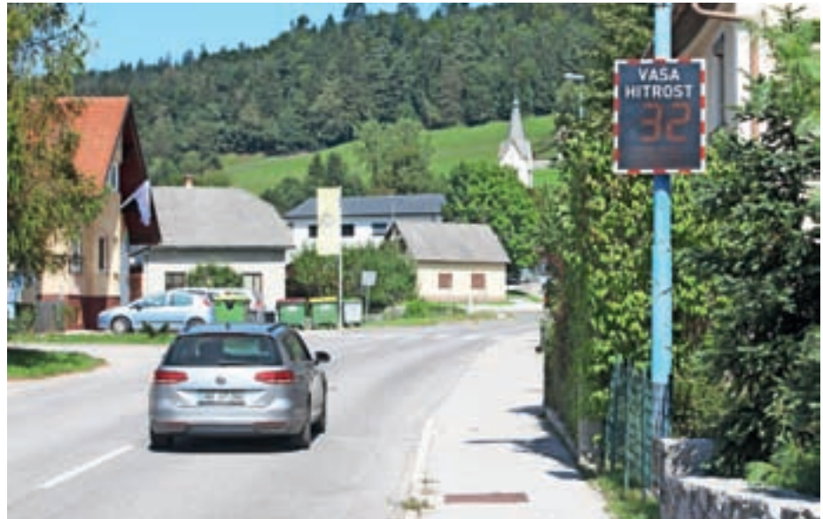
Novi merilnik hitrosti na Loški cesti