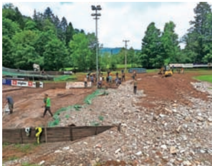
Nordijski center Poclairn je v poplavih utrpel veliko škodo, ki jo bomo sanirali še kar nekaj časa.

Žal pa v avgustu nismo bili izvzeti iz naravnih nesreč. Nordijski Center Poclairn je utrpel veliko škodo, ki jo bomo sanirali še kar nekaj časa. Voda je poplavlila garderobe, tehnično sobo in skladišče z opremo, najhuje pa je bilo v izteku skakalnic in na delu parkirišča. Na parkirišču je odneslo dobršen del brežine in asfalta ter spodkopalo drog z reflektorji, s skakalnic pa je odneslo precej plastike in poškodovalo ograjo. V najnižji del izteka je nanoslo veliko naplavin v obliki peska, skal in zemlje. Zopet smo dokazali, da v Žireh s skoki mislimo resno. Tako je bilo pri sanaciji v zgolj dveh tednih narejenih več kot 900 delovnih ur, ki so jih izvedli prostovoljci iz vrst staršev, navijačev, trenerjev, športnikov in vodstvenih delavcev kluba. Na delovne akcije so se odzvali tudi