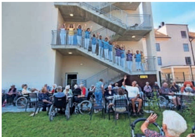
Poletje je SeneCura domu starejših občanov Žiri prineslo tudi nove izzive.

Prav za vse opisano gre zahvala tako stanovalcem kot njihovim svojcem za izredno razumevanje in podporo. Največja zahvala