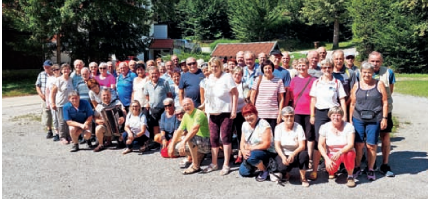
Upokojenci na izletu v neznano